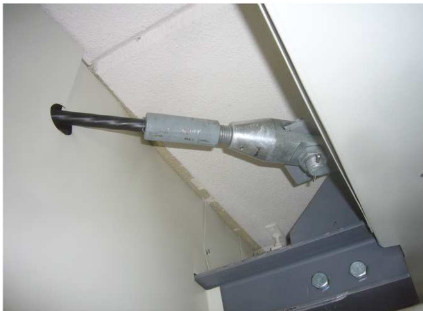
壁を開孔しての水平ブレース設置状況