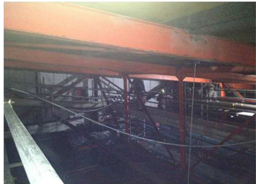
躯体を避けての配線状況