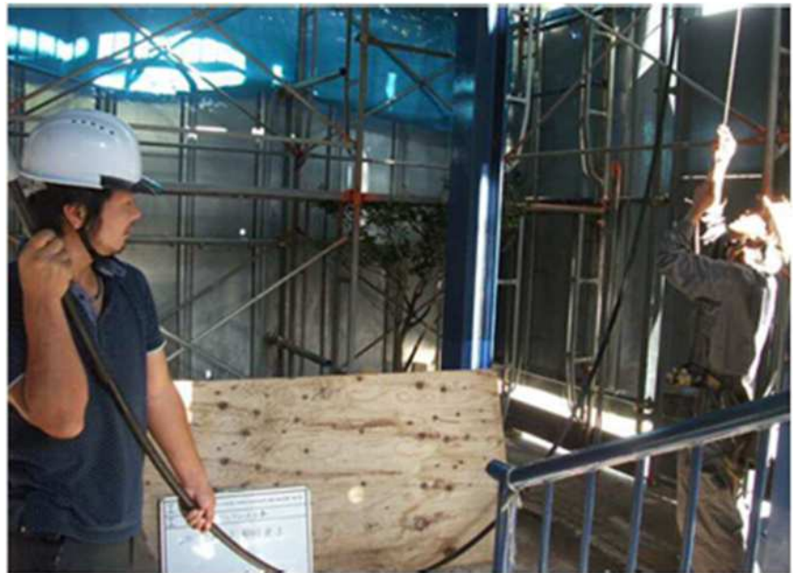
足場と躯体の隙間への配線状況