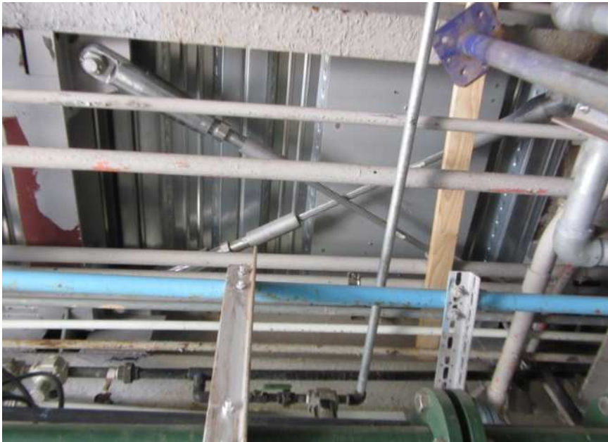
天井裏の狭小空間への設置状況