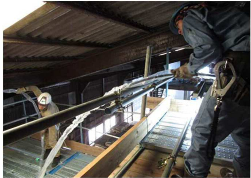
足場を避けての配線状況