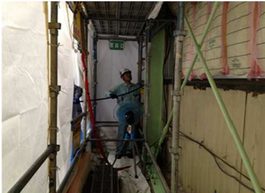
足場と壁の隙間への配線状況