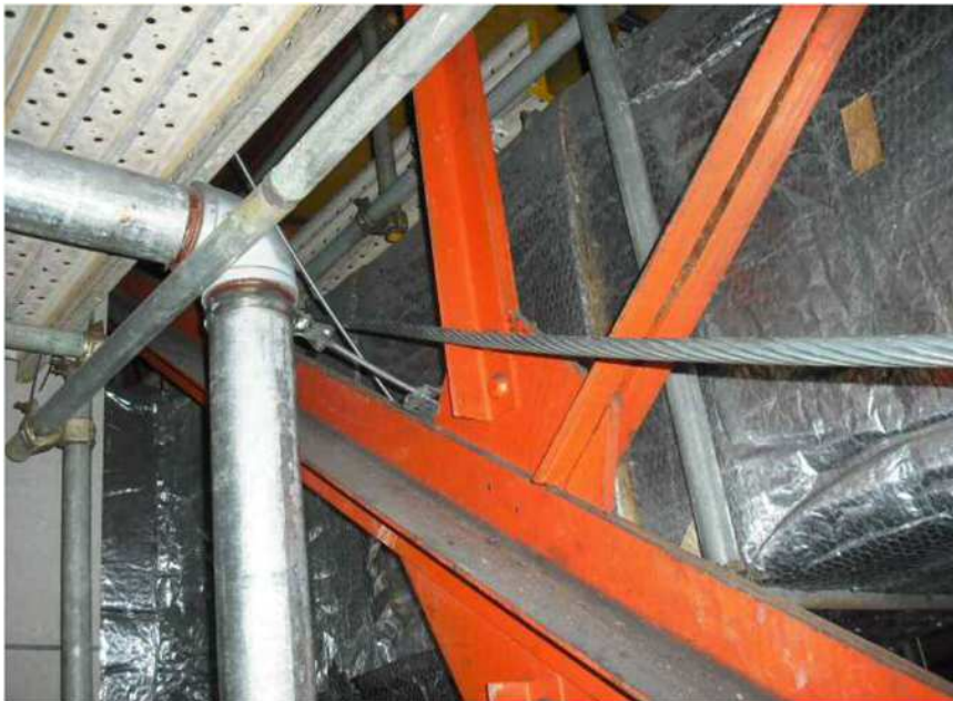
足場と躯体の隙間への配線状況