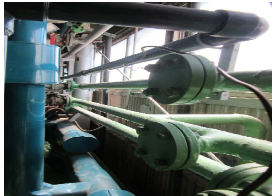
壁面への設備を避けての設置状況