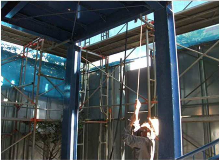
足場と躯体の隙間への配線状況