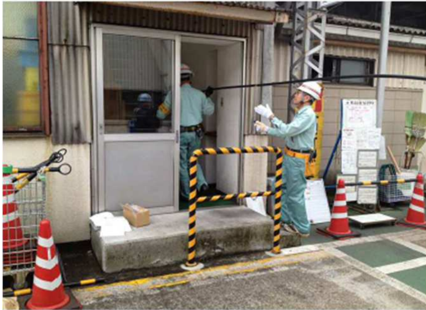
建物入口への搬入状況