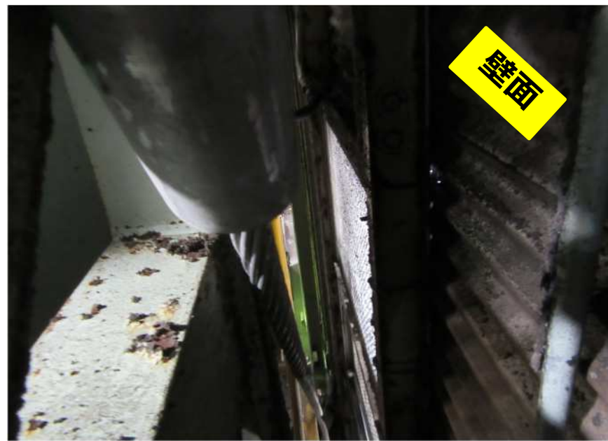
狭小空間での軸ブレース設置状況