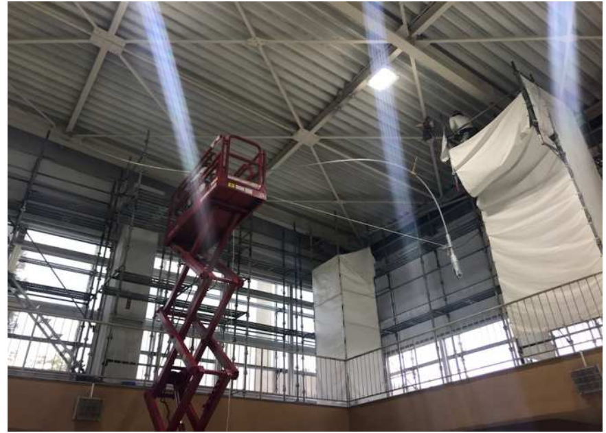
高所作業車と限られた足場での施工