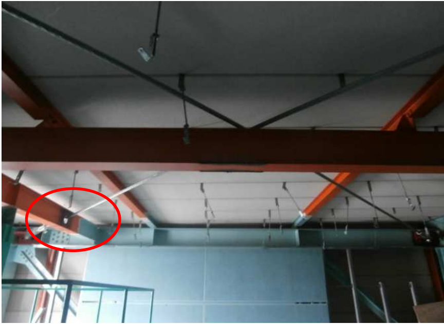
小梁へ孔を開けての施工