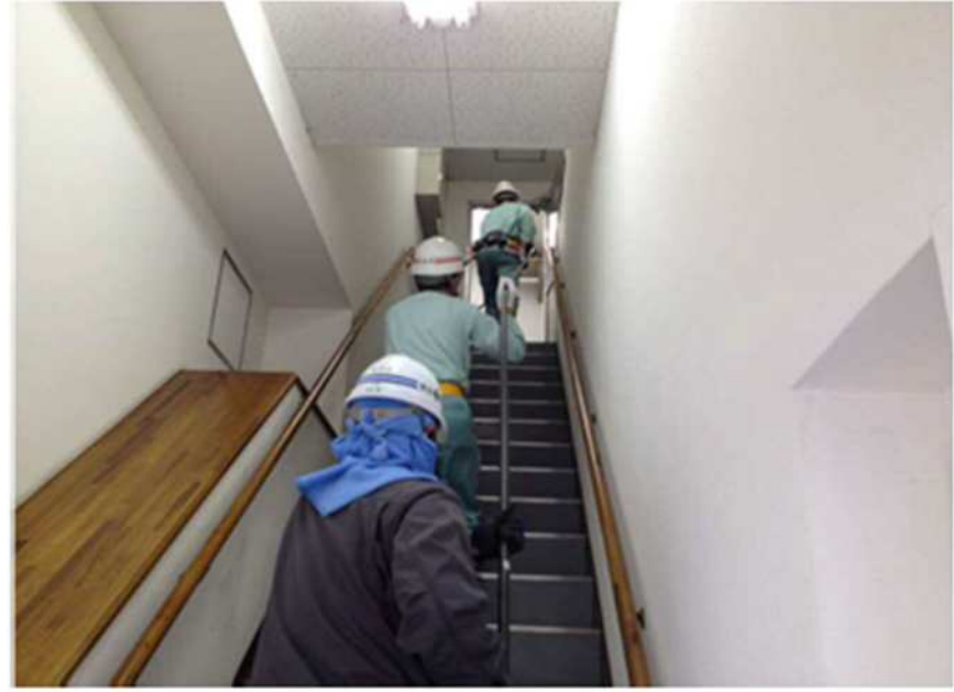
階段での運搬状況